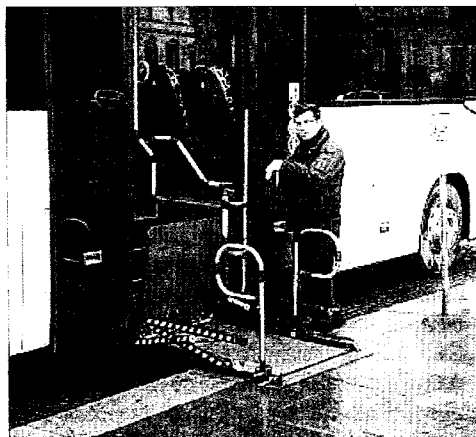
Uno dei nuovi autobus Euro 5

FORLÌ - Da metà gennaio i primi due autobus euro 5 a gasolio, attivi nelle province di Forlì-Cesena e Ravenna. I nuovi mezzi, acquistati da Setram per rinnovare il parco macchine e rispondere alle esigenze di sempre maggior tutela ambientale e attenzione per i viaggiatori, verranno utilizzati per il servizio extraurbano che collega le due Province. Sono i primi autobus della categoria Euro 5 con alimentazione a gasolio ad essere attivi nelle Province di Forlì-Cesena e Ravenna. Si tratta di mezzi, modello Setra MultiClass moderni, tecnologici, sicuri e completi di tutti i comfort per i viaggiatori, che saranno impiegati dalla metà di gennaio sulle linee di trasporto extraurbane 156 e 149 che collegano Ravenna con Forlì e con Cesena.